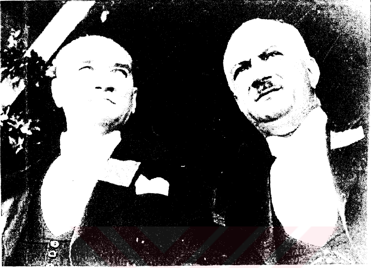
Cumhuriyetin Kuruluşunun 10.yıl töreninde Gazi Mustafa Kemal Atatürk ve Mehmet Recep Peker, 29 Eylül 1933